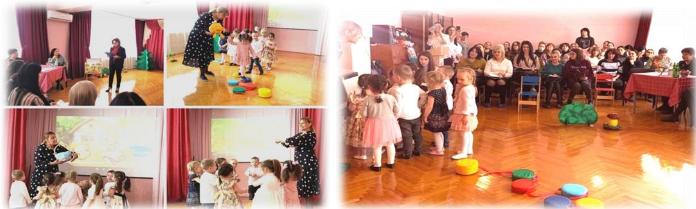
Игра «Найди тень»

В ходе заседания рассматривались такие вопросы, как «Формирование духовно – нравственных ценностей воспитанников» .